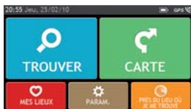
Menu Spirit QuickStart™