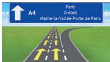
Vue 3D des croisements